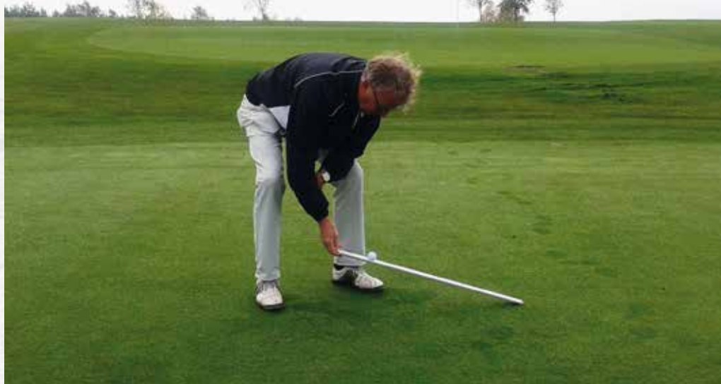
Ondanks de dauw vormt de teamleider zich op hole 2 met de stimpmeter een oordeel over de snelheid van de green.

waterkoud. De buienradar is in een uitstekende bui en laat de hele dag geen spatje regen zien. Een vlucht luid gakkende ganzen, in wijde V-formatie, steekt af tegen de grijze lucht. Op aanwijzing van de NGF hebben de nijvere leden van de baanadviescommissie twee dagen geleden met symbolen aangegeven, waar de landingsgebieden van een nul-handicapper en van een bogeyspeler zijn. Regelmatige