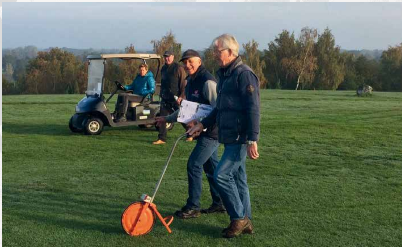
De baanadviescommissie is druk bezig met de voorbereiding voor de NGF-rating.