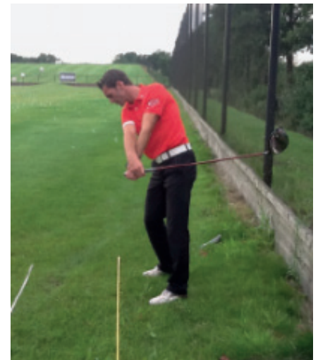
Foto 3. Op het juiste lanceerpunt gekomen.

Andere spelers die de krachtbaan niet kennen, vergeten de schouders door te draaien, waardoor de armen voorbij het lichaam schieten. Dat veroorzaakt korte pulls(links) en hooks.