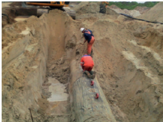
Het laatste stukje...