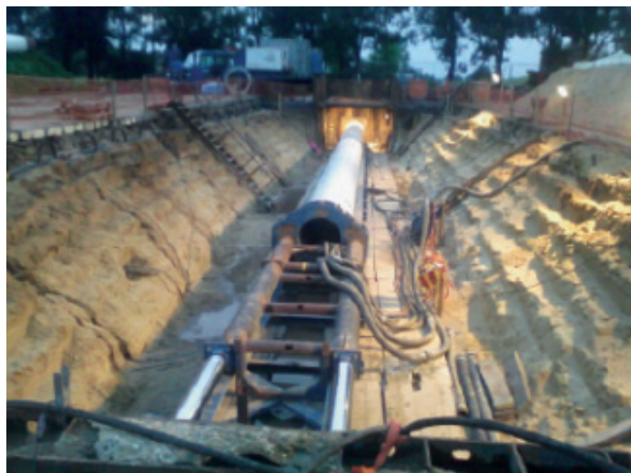
's Nachts werken...

overdag aan elkaar gelast, zodat geen tijd verloren ging. Daar waren vier lasers voor nodig, twee werkten aan het bovenste gedeelte en twee stonden in de lasput onder de buis. De lasnaden