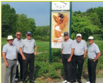
Heren I senioren