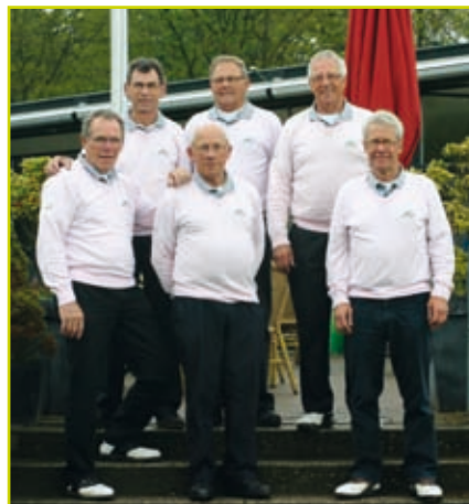
Heren II senioren