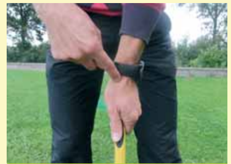
Kuiltje in je polsgewricht op het midden van de grip, duim ligt net iets links uit het midden.