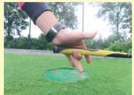
Controle-oefening: kijk of je de club met je middelvinger in balans kunt houden en voel dat de grip onder je linkermuis zit.