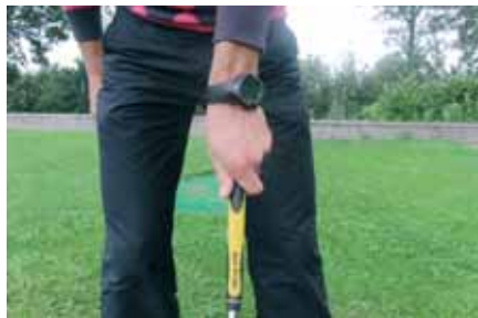
Grip linkerhand te sterk, je ziet meer dan twee knokkels - curve naar links.