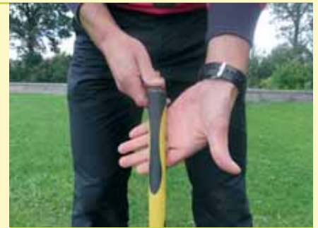
Grip linkerhand: grip de club in het begin van de vingers, wijsvinger het middelste kootje.

Op de volgende foto's kunt u zien hoe de grip aangelegd kan worden en hoe het totale plaatje van een goede grip eruit ziet.