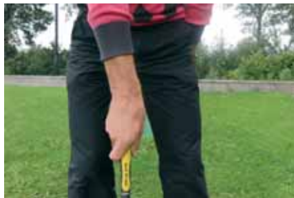
Grip rechterhand zwak, te ver eroverheen geplaatst - curve naar rechts.