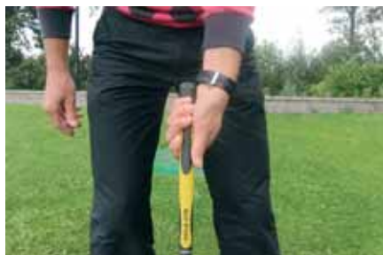
Grip linkerhand zwak, je ziet helemaal geen knokkels - curve naar rechts.