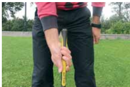
Grip rechterhand sterk, te veel eronder geplaatst - curve naar links.