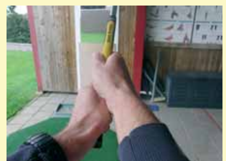
Bovenaanzicht zoals u er zelf naar kijkt.