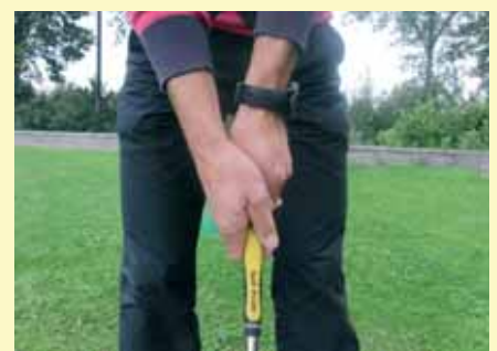
Plaats je rechterhand parallel aan je linkerhand, met de v'tjes wijzend naar je rechterwang.