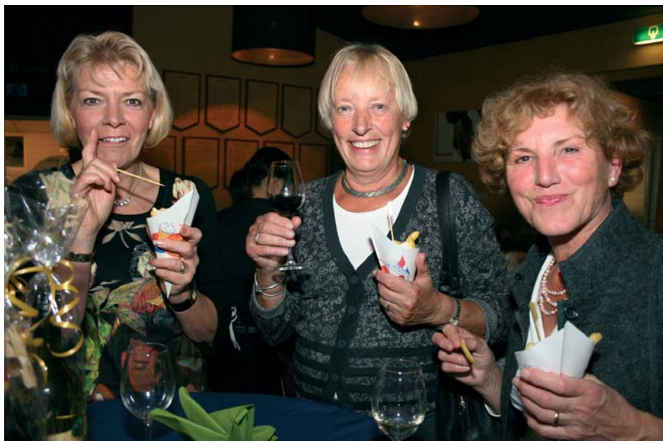
Deze dames genieten zichtbaar tijdens het "walking dinner" op de gezellige en drukbezochte vrijwilligersdag in 2009...