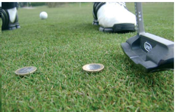
Oefening 5: raakpunt oefening