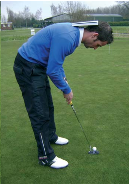
Oefening 1: check oefening