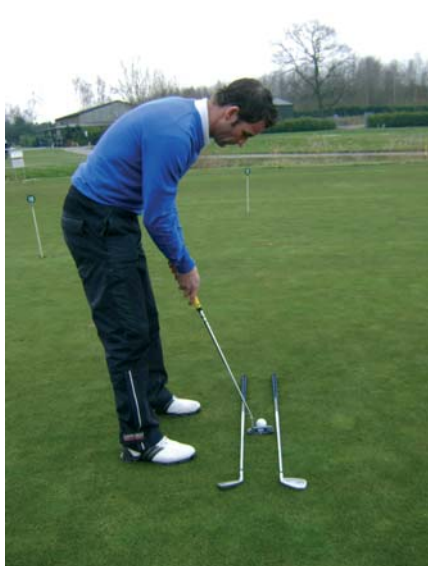
Oefening 3: putt stroke oefening