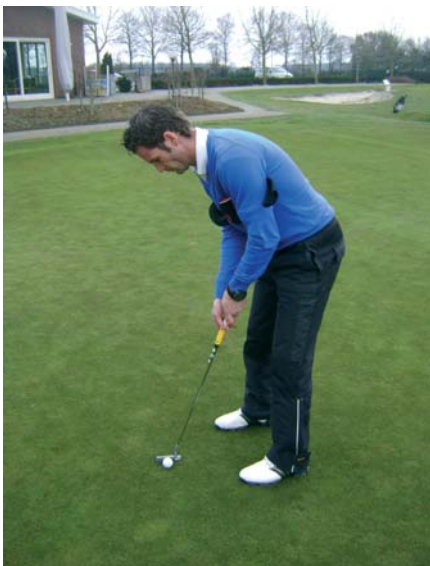
Oefening 2: oksel oefening