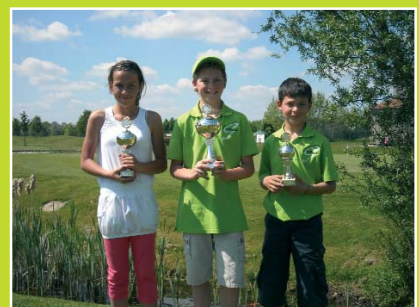
Winnaars categorie D