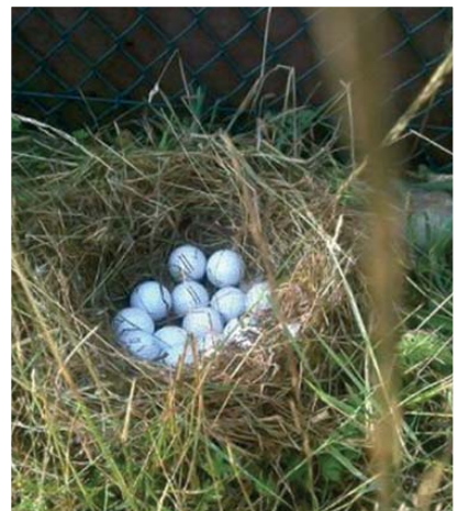
Eend broedt op 15 golfballen.