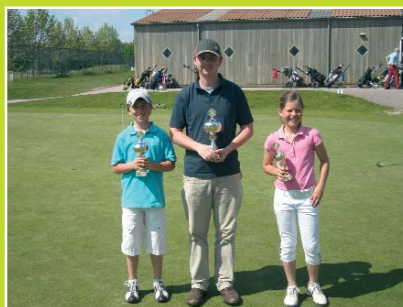
Winnaars categorie A

Er is in 4 categorieën gespeeld. Categorie A (handicap 0 - 18.4) strokeplay, 18 holes. Categorie B (hcp 18.4 - 36) stableford 18 holes, categorie C (hcp 36.1 en hoger) stableford 9 holes categorie D (jeugdleden met baanpermissie) stableford 2 x 9 holes Americabaan.