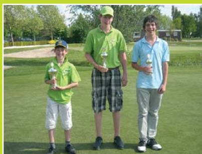
Winnaars categorie B